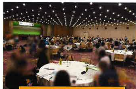
グループディスカッション

私が所属したグループでは、北陸の原告がグループリーダーを、私がサブリーダーを担当し、「各地の原告交流方法に学ぶ」をテーマにディスカッションを行いました。このグループには、北海道から福岡まで、全国各地の原告・弁護士が所属。各地での様々な取り組み事例を報告し合い、活動を行う原告への交通費支給に向けた全国ガイドラインの策定や医療講演会動画データ等交流会で使用する「素材」を全国各地で共有するためのデータベースの構築など大変有意義な提案をまとめることができました。この初めての試みは大成功だったと思います。