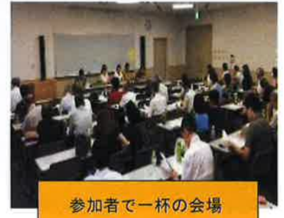
参加者で一杯の会場

総会前に、原告4名、弁護士7名で、近江町市場の前で“一生に一度は肝炎ウイルス検査を受けましょう”と啓発活動を実施。ティッシュを一つ一つ道行く方々へ渡すときには、「検査して早期発見して欲しい。この病気を知って欲しい。」と願いを込めてお渡ししました。早期発見、早期治療が啓発活動の目的です。私達は原告でもあります。治療などたくさんの辛い経験をして来た患者だからこそ、早期発見を誰よりも願い、この活動をしています。