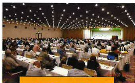
参加者で一杯の会場

この会議には、全国各地から原告約200名、弁護士約35名が集い、北陸からも、原告4名と同伴者1名、弁護士3名が参加しました。会議では、担当弁護士から、医療費助成の実現等に向けた政府・国会議員への要請活動や厚生労働大臣協議の結果などが報告され、原告のみなさまからのご質問にお答えしたほか、全国各地の原告団活動についても報告が行われるなどしました。